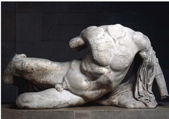
Fig. 1 - O statueta realizată de sculptorul grec Fidias, dintr-un singur bloc de marmură, ce se crede că ar reprezenta Zeul râului Illisos din Atena. Lucrarea este inclusă în expoziția permanentă a Muzeului Național al Marii Britanii.

Prin intermediul unui studiu, pe care l-am încheiat în urmă cu patru ani, am constatat cu oarecare consternare faptul că tema nudului nu mai este frecvent întâlnită în lucrările de artă, prezentate de tânăra generație, în expozițiile organizate cu diverse prilejuri în