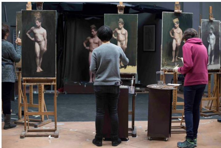
Fig. 2 - Fotografie care surprinde atmosfera de lucru academică din Academia de Artă din Florența.

Studiul nudului în timpul perioadei de formare artistică nu presupune ca toate lucrările din curiculă să conțină tema nudului, precum nici orice reprezentare a nudului nu va putea fi automat considerată artă dacă nu sunt