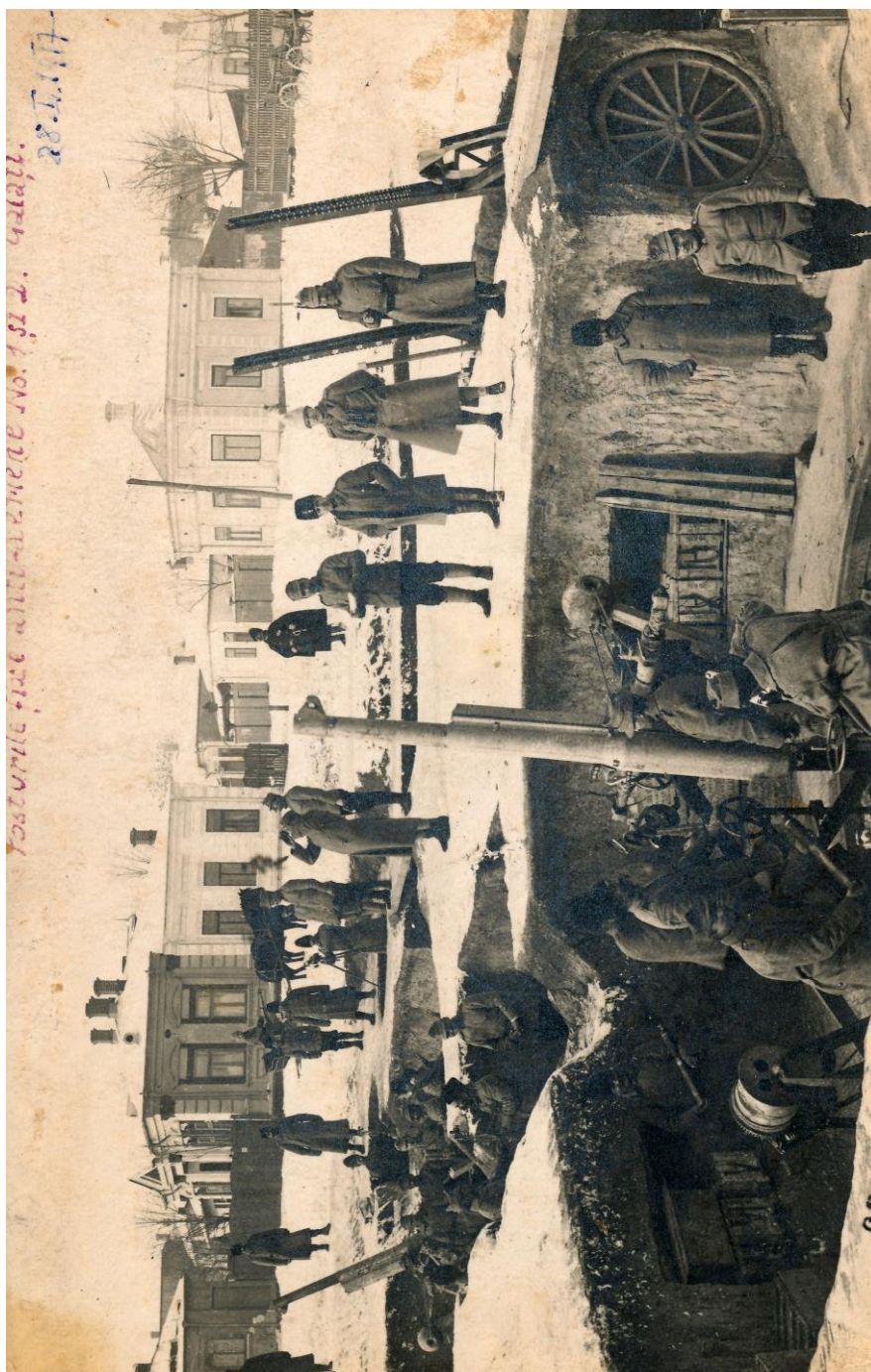
Posturile fixe antiaeriene nr. 1 și 2 Galați, 28.01.1917, din colecțiile Muzeului de Istorie „Paul Păltănea” Galați.