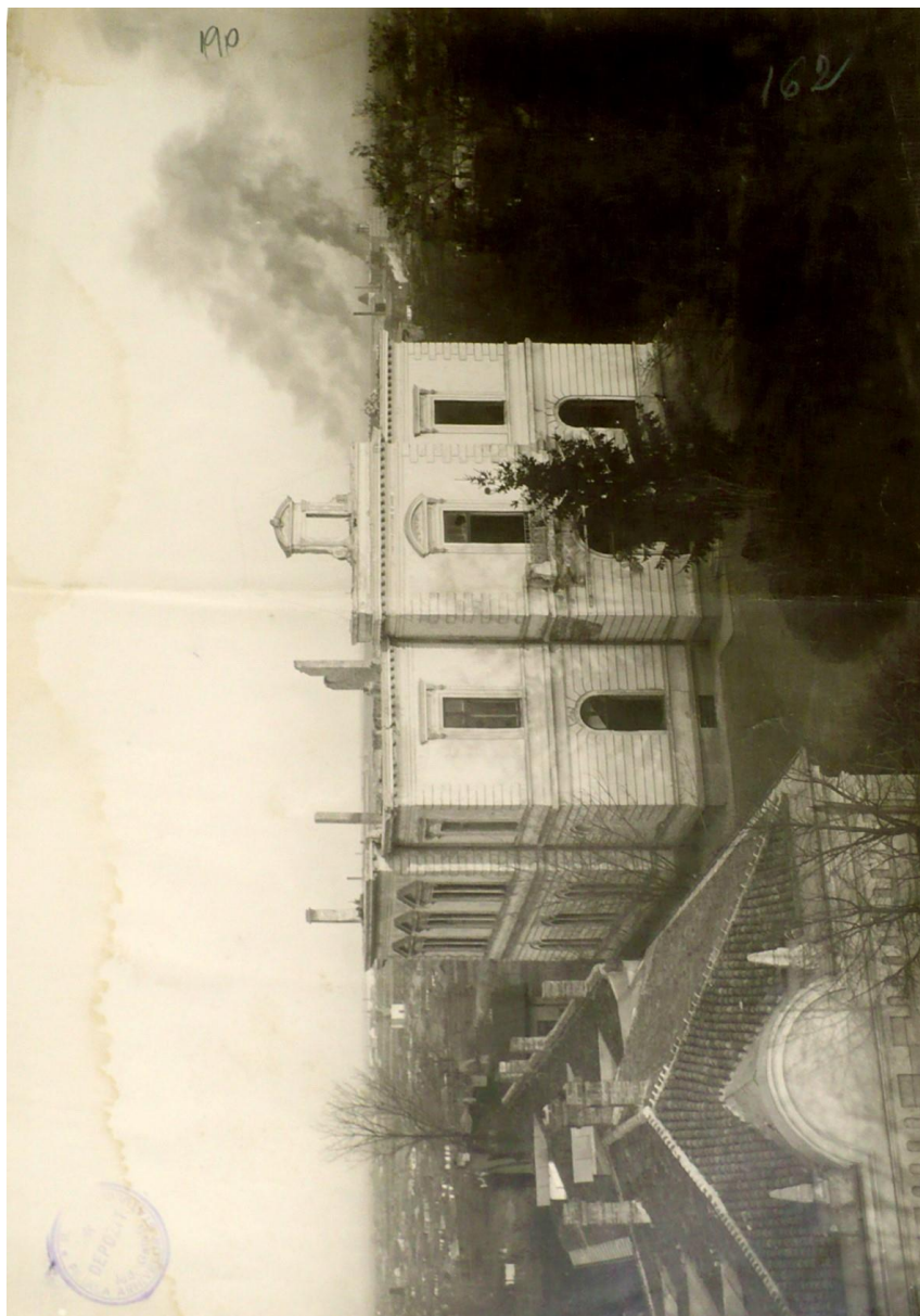
C.E.D. bombardat 1917, SJANG, Fond Primăria Oraşului Galaţi , dosar 121, an 1918, f. 190.