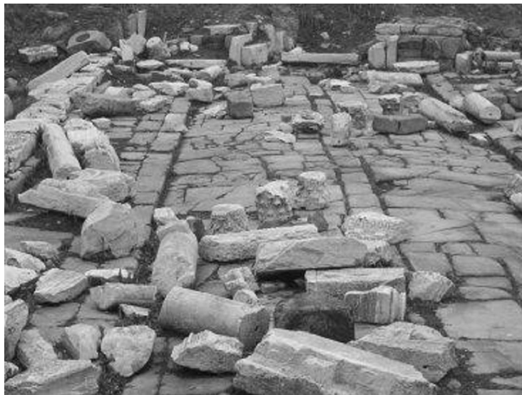
Fragmente din arcul triumfal ce se află de-a lungul Via Diagonalis .