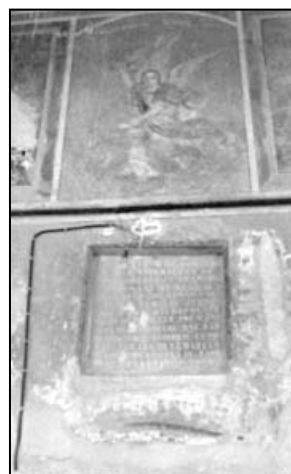
Fig. 3. Biserica din Broșteni, citorită de Evanghelie Zappa și pisania

În timp, se va manifesta ca un mare filantrop. A contribuit financiar la întemeierea Societății Literare (mai târziu Academia Română) și a oferit domnitorului Alexandru Ioan Cuza 24 , în februarie 1860, o donație de „3.000 de galbeni, pentru cultura limbii și literaturii române” 25 . Din aceștia, 800 de galbeni erau pentru realizarea unor traduceri din autori clasici, la care a mai adăugat peste 2.200 de galbeni pentru a contribui la „Fondul Zappa”, prin care oferea fonduri pentru premiile literare și științifice acordate unor personalități precum T. Cipariu, pentru Gramatica română 26 (200), August Treboniu Laurian și I.C. Massim pentru Dicționarul Limbii romane 27 (2.000 de galbeni).