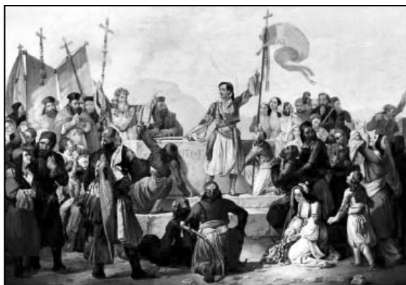
Fig. 2. Ludovico Lipparini: Lord Byron la mormântul lui Markos Botsaris în Missolonghi (Lithografie color.1850, The Engravings Collection of the National Historical Museum, Athens) 20

ani se alăturase luptătorilor aromâni sulioți conduși de Markos Botsaris 18 (fig. 2), iar mai târziu avea să lupte în războiul de independență al grecilor (1821-1830) 19 .