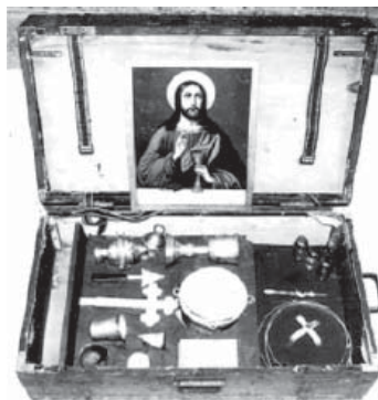
Fig. 1. Trusa folosită de preoții militari în Primul Război Mondial 12

„Iunie 3. Sâmbătă. Astăzi am făcut liturghie și parastas pentru soldații morți în Tungujei. A slujit și părintele Stăncescu din Țibănești, care cu această ocazie a ținut o cuvântare foarte frumoasă, vorbind despre „înstrăinarea omului de la legea creștină și războiul actual. A vorbit admirabil ! Excelează prin comparațiuni cu exemple din viața de toate zilele. Mi-am întărit și mai mult convingerea că este cu adevărat apostol al..., așa cum ni-l închipuim noi în visurile noastre de români. După aceea, s-a făcut procesiune cu prapore și cruci la cimitir, unde s-au citit molitve de dezlegare. A fost o zi memorabilă: până când noi citeam molitvele, soldații, toți, puneau la fiecare mormânt – ce purta o cruce și fusese de curând dres – câteva flori adunate de pe câmp sau din grădini. S-au împărțit după aceea colaci și colivă la soldați, bătrâni și copii, și toți au plecat cu sufletul mulțumit că au putut face ceva pentru camarazii lor, morți pentru patrie.” 15