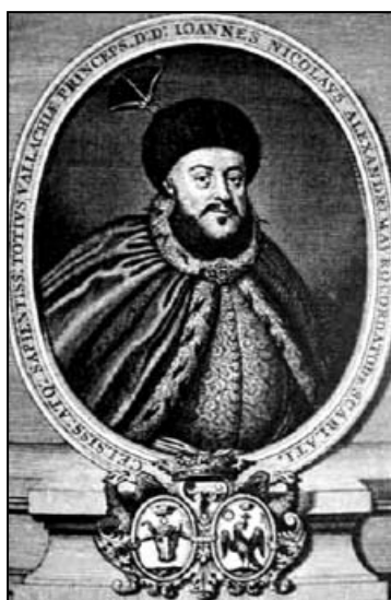
Fig. 1. Nicolae Mavrocordat. Gravură de J. P. Wolfgang, din 1721, publicată în Liber de Officiis , Leipzig, 1722.

În 1714, Nicolae Mavrocordat (fig. 1) stipula în edictul său că „poate face studii aici oricine dorește, fără a plăti“. Existau, de asemenea, bursieri, chiar de peste hotare, astfel că la un moment dat Academia va avea un caracter interbalcanic și va contribui la formarea sistemelor de educație din alte țări ale Peninsulei Balcanice.