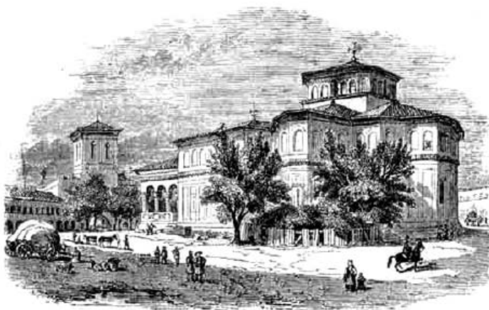
Fig. 4. Biserica „Sfântul Gheorghe“ București. Gravură după un desen de M. Bouquet. 1841

Școli funcționau și în alte orașe decât București, cum se întâmpla la Târgoviște, unele chiar în mediul rural și cele mai multe erau dotate cu biblioteci impresionante, din care nu lipseau lucrări contemporane, achiziționate din centre