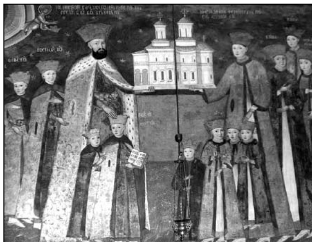
Fig. 5. Domnitorului Constantin Brâncoveanu și familia sa, în postură de ctitori ai Mănăstirii Hurezi.

ziene, supuse ori vasa- le Turcilor, ca și față de grecitatea europeană, [domnul a știut] să în- locuiască pe împărații bizantini de odinioară, ca un urmaș legitim al căroră era privit“.