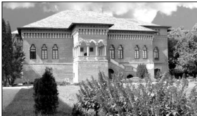
Foto 1. Palatul de la Mogoșoaia

Conținutul modelului brâncovenesc a fost legat de timp, așa cum se întâmplă cu toate modelele, dar el a supraviețuit prin partea cea mai nobilă a oricărui model, prin formele artistice, și a conturat un stil. 14