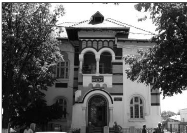
Foto 9. Poșta Tecuci

terasa largă, care se desprinde de pe linia fațadei, jucând rolul de pasaj acoperit pentru intrarea în clădire. Influențele brâncovenesti se pot observa la arcadele trilobate în acolade, sprijinite de cele șase coloane de piatră, cu fusuri netede și capiteluri compozite, pătrate.