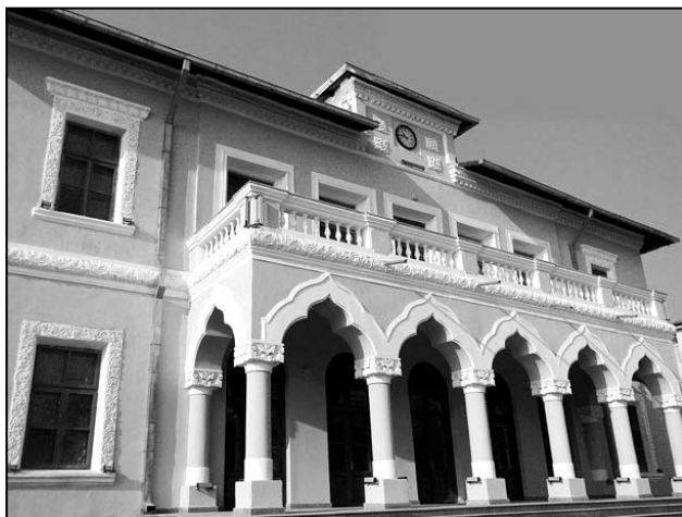
Foto 8. Fosta Primărie Tecuci, azi Casa de Cultură

Venind dinspre Galați, via Liești, pe strada 1 Decembrie 1918 din municipiul Tecuci, pe partea dreaptă, colț cu strada Ioan Petrovici, se află clădirea în care funcționează Parchetul Tecuci. Clădirea construită în anii '30 pentru Banca Poporului, își etalează fațadele asimetrice pe cele două străzi. Unghiul ascuțit pe care ar fi trebuit să-l formeze pereții exteriori, a fost atenuat de frontonul ce include