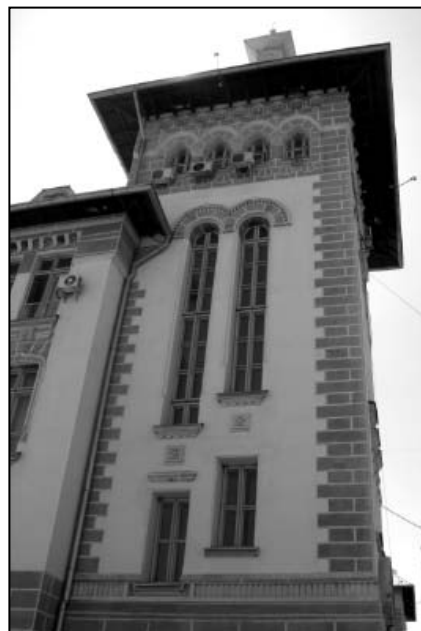
Foto 4. Turnul Palatului Navigației, Galați

Arhitectul Petre Antonescu se va ocupa în perioada 1909-1912 16 , de elaborarea și supravegherea construcției Palatului Navigației. Clădirea, monument istoric, este unică în zonă, fiind definită de un program de arhitectură determinat de destinație și de natura terenului. Pe colțul de nord-est al clădirii se detașează un turn, mai înalt decât acoperișul clădirii, în care se află o scară de onoare. Turnul, aidoma foșoarelor brâncovenești, se remarcă nu numai prin zveltețea sa, ci și prin colonetele cu capiteluri compozite (foto 4) care sprijină arce trilobate în partea superioară a acestuia.