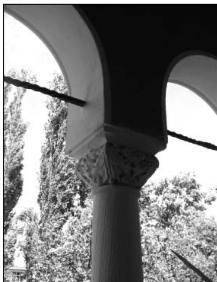
Foto 11. Detaliu Poșta Tecuci

căror arce trilobate susținute de coloane canelate verticale, în spirală (foto 11) sau netede, cu capiteluri compozite amintesc de stilul brâncovenesc.