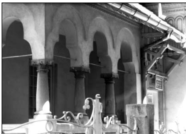
Foto 10. Detaliu casă str. Victoriei, nr. 14

terasa largă, care se desprinde de pe linia fațadei, jucând rolul de pasaj acoperit pentru intrarea în clădire. Influențele brâncovenesti se pot observa la arcadele trilobate în acolade, sprijinite de cele șase coloane de piatră, cu fusuri netede și capiteluri compozite, pătrate.