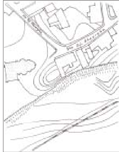
Fig. 2. Poziția bisericii „Sf. M. Mc. Gheorghe“ - monument istoric