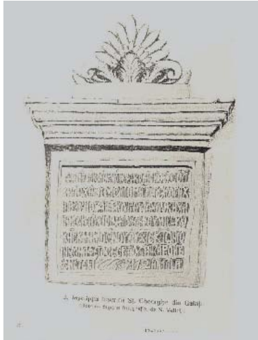
Fig. 1. Pisania Mănăstirii „Sf. Gheorghe“ din Galați