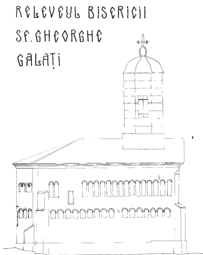
Fig.1 Releveul bisericii - fațada de vest, scara 1: 50

La 18 martie 1710, osemintele hatmanului Mazeppa au fost mutate de la Varnița la Galați, de către rudele sale, care doreau să le ducă la Ierusalim, dar din cauza turcilor au trebuit să se oprească în orașul de pe malul Dunării, unde le-au depus la Mănăstirea „Sf. M. Mc. Gheorghe“ (supranumită și Ierusalim) 15 . Aici au rămas doar până în anul următor, când turcii jefuind mănăstirea le găsesc și le aruncă în fluviu.