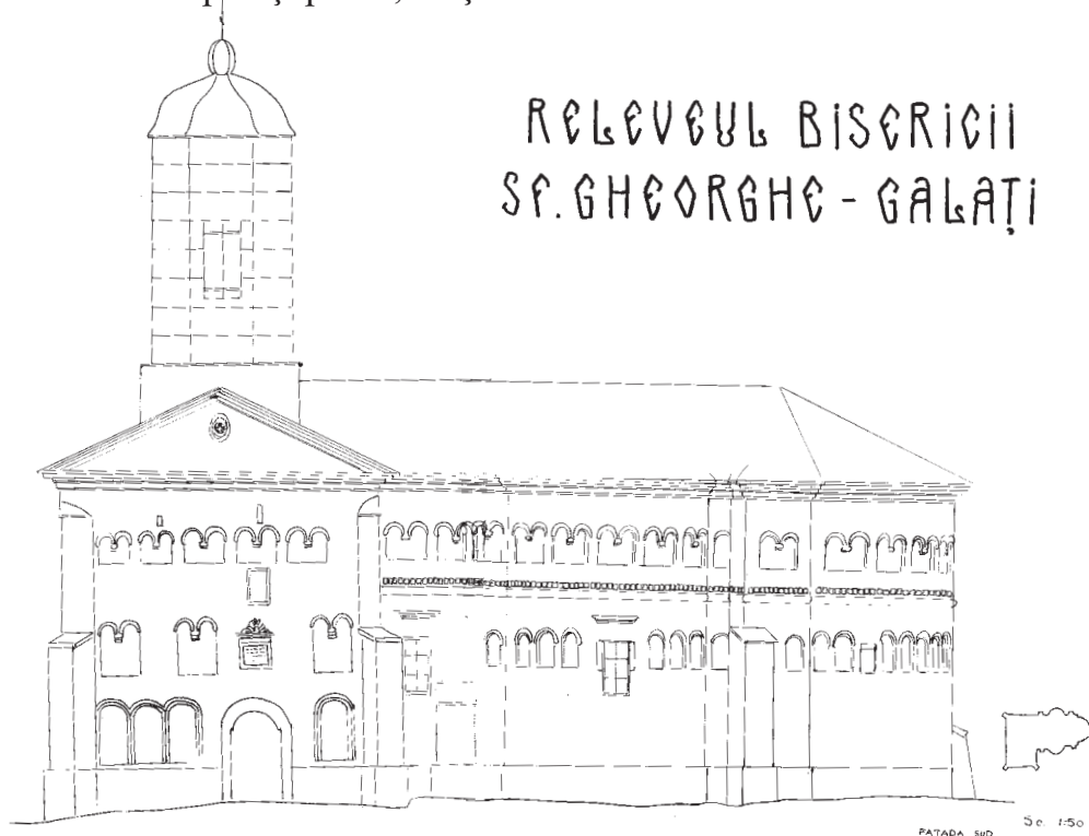
Fig.4. Relevul bisericii - fațada de sud

Catapeteasma era lucrată în lemn de tei și era pictată în stil bizantin. Tot în interiorul bisericii se afla un cafas mare cu grilaj de lemn și un amvon din lemn sculptat și poleit, susținut de o scară cu balustradă. 30