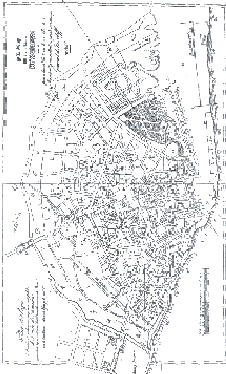
1. Planul oraşului Braşila ridicat în 1834 de către maiorul Berroczy