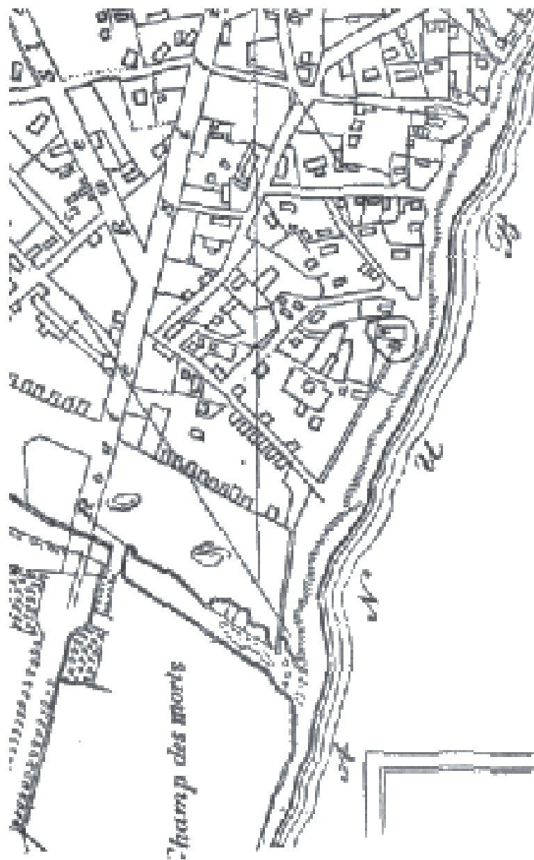
2. Planul oraşului Brăila ridicat în 1834 de către maiorul Berroczy Detaliu din zona de sud cu amplasamentul bisericii Mitropoliei Proilaviei, iar mai spre sud cimitirul (câmpul de morţi)