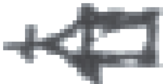
4. Schița pentru consolidarea malului Dunării în zona bisericii Mitropoliei Proilaviei, realizată de către polcovnicul Nicolae Meșterul de Mori în 1840. Detaliu cu înfățișarea bisericii (după Andrei Pănoiu)