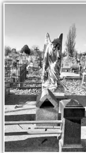
Fig. 7. Monumentul familiei franciscane a fraților Conventuali