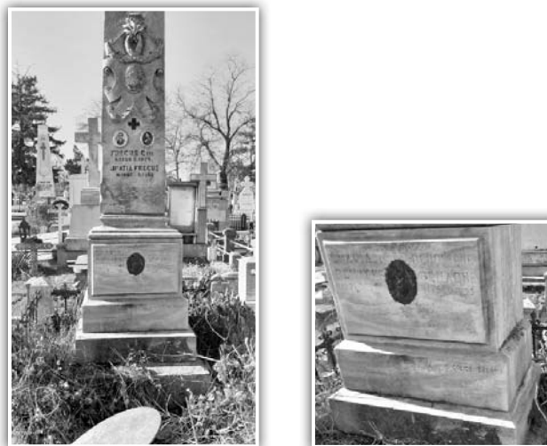
Fig. 16. Monumentul familiei Benache