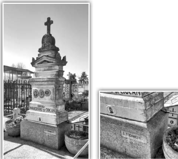
Fig. 3. Monumentul familiilor Paraskaki și Ciocan