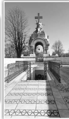
Fig. 23. Mausoleul eroilor români din războaiele: 1916-1919 77