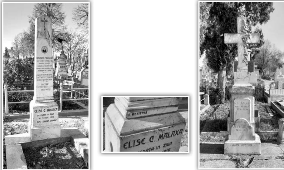
Fig. 2. a. Mormântul familiei Malaxa; b. semnatura sculptorului; c. Monumentul fostului primar G. I. Aslan

mitirul din Tulcea, poate fi văzut Mormântul Stefanos și Athina Vazacas 46 semnat de I. Renieris 47