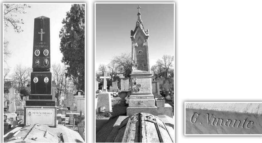
Fig. 9. a. Monumentul familiei Supionas; b. Monumentul familiei Anghel; c. Semnătura lui G. Vinante

În apropierea Capei catolice am găsit, și un mormânt care nu mai poartă niciun nume, dar care pare, după tehnica de realizare să