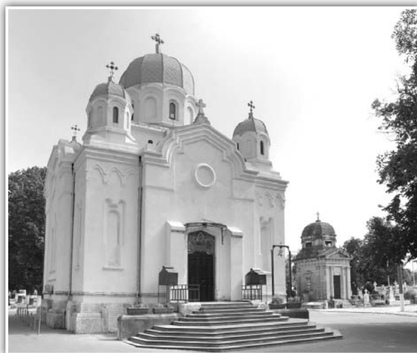
Fig. 22. Biserica „Adormirea Maicii Domnului“

parte dintre sculptorii menționați, în Brăila, Sulina și Focșani și chiar în zone mai îndepărtate fizic cum ar fi orașul Botoșani. Schimbările din prima jumătate a secolului al XIX-lea în plan juridic, vor duce și la schimbări de mentalitate, la care va contribui și dinamica deplasărilor spre Occident, mai cu seamă pentru studii ale fiilor celor bogați, precum și din considerente economice și comerciale. În același timp, constatăm că locuitorii orașului Galați sunt deschiși întâlnirii cu ceilalți, preferând însă pe cei ce vin din spațiul Mării Egee, ce aduc cu ei modele ale Ortodoxiei Răsăritene. Fără îndoială, investigarea bunurilor de