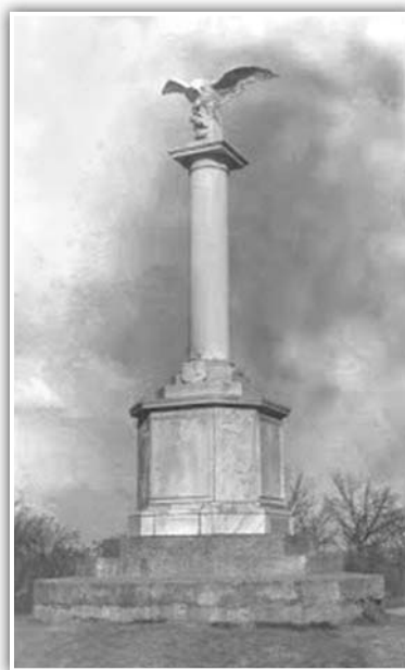
Fig. 19. Monumentului eroilor români căzuți la Constangalia (iulie 1864)