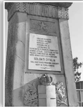
Fig. 24. Monumentul eroilor italieni