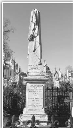
Fig. 18. Mormântul familiei Cavalliotti