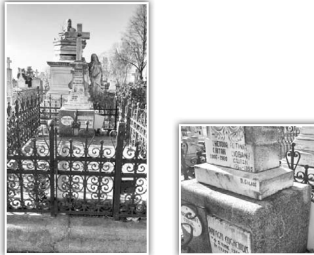
Fig. 15. Monumentul familiei Malcoci cu semnătura sculptorului