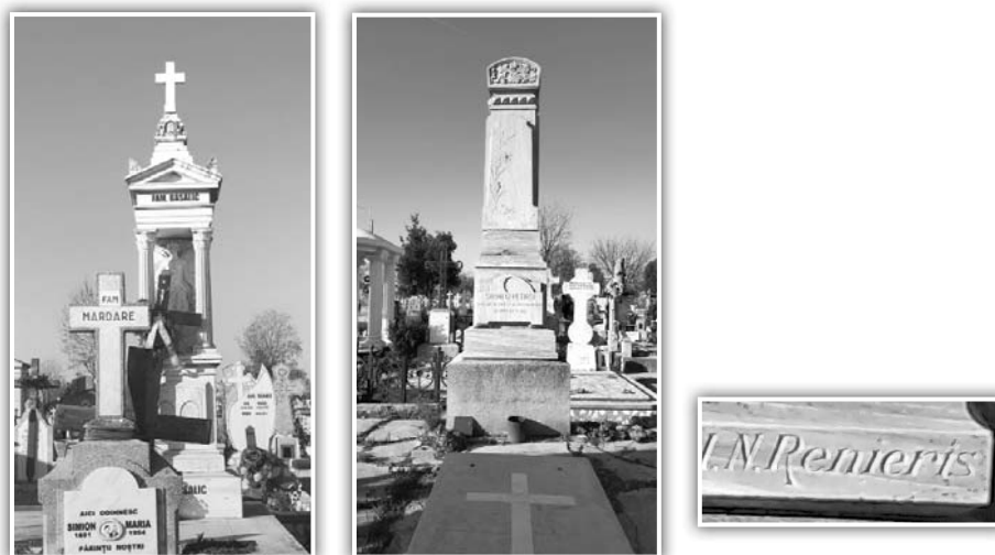
Fig. 4. a. Mormântul familiei Basalic și b. Mormântul lui Sava Petroi