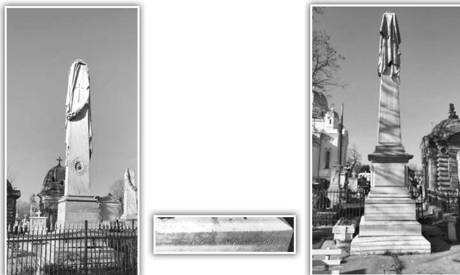
Fig. 13. a. Mormântul lui Panait C. Nica; b. Mormântul Familiei Doichiu

La Sulina, cei doi sculptori vor amenaja mormântul Prințesei Ecaterina Moruzi (1836-1893), nepoata lui Ioan Sturdza, fost domn al Moldovei (1822-1828), soția lui Constantin Moruzi. Pe piatra funerară apare și blazonul familiei Moruzi, iar textul este redactat în limba română, indicând data nașterii și locul – Constantinopol și data morții 1893, la Sulina 55 .