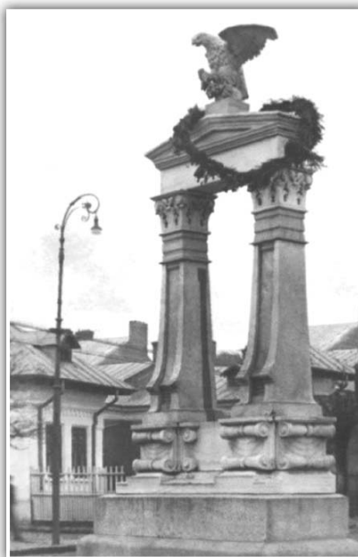
Fig. 1. Monumentul Apărătorii orașului Galați (1921)

De asemenea, Nicolaos P. Renieris a realizat în Cimitirul „Eternitatea” monumentul funerar pentru Familia Mantu 41 , în timp ce fiul său, Ioannis N. Renieris, a creat monumentele pentru familiile Malaxa (fig. 2 a și b) 42 , Macris 43 , Zoia 44 , Aslan (fig. 2 c), Paraskaki și Ciocan (fig. 3), Basalic (fig. 4 a), Mormântul lui Sava Petroi († 1912, fig. 4 b), precum și Monumentele Familiei Petrache Jeles (fig. 5 a), Olaru (fig. 5 b), Monumentul Familiei Chivu (fig. 5 c) și altele 45 . În același timp, în Ci-