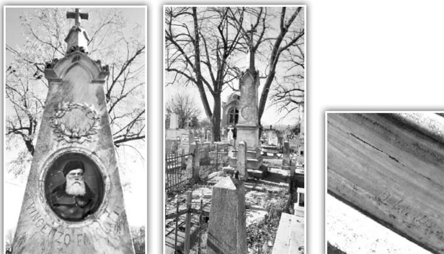
Fig. 14. Monumentul lui Vincenzo Fancotti și semnătura D. Liritis

Un Simon D. Lyriris , originar din Tinos, unde s-a născut în 1866, va ajunge în România și va deschide un atelier în Brăila. Va lucra trei monumente și pentru Cimitirul din Galați.