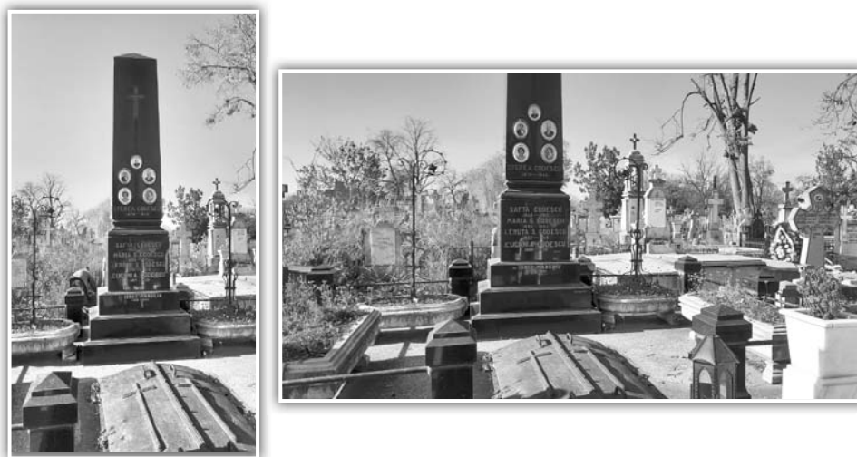
Fig. 8. Monumentul funerar al familiei Codescu, realizat în 1913

De asemenea, știm că Giuseppe Vinante are lucrări realizate în Galați, ca de exemplu, monumentul familiei Anghel (fig. 9 b).