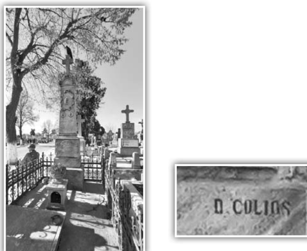
Fig. 21. Monumentul funerar al familiei Veneri și semnătura D. Colios

dirii Băncii din Viena, a celei care va adăposti o perioadă Ministerul de Război, a nu mai puțin de patruzeci de biserici ș.a. Va fi primul care va introduce granitul suedez și va încerca prelucrarea pietrei cu ajutorul mașinilor (strunguri și șlefuitoare), fiind considerat în Austria drept fondatorul industriei moderne în domeniu 75 . Tot el a realizat monumentul care-l reprezintă pe Ludwing van Beethoven în piața care poartă numele compozitorului. Numele său este legat de o lucrare realizată în marmură neagră, în cimitirul Eternitatea din Galați, pentru frații Hagi Vasile Frigator (1813-1887) și Dimitrie Frigator (1838-1902) 76 , astăzi mormântul fiind al familiei Clim. Cel de-al doilea, devenit bancher, a fost un mare filantrop, fiind fondator al unui azil de bătrâni, a unei cantine școlare și a unui corp de clădire pentru Spitalul „Elisabeta Doamna“ din Galați.