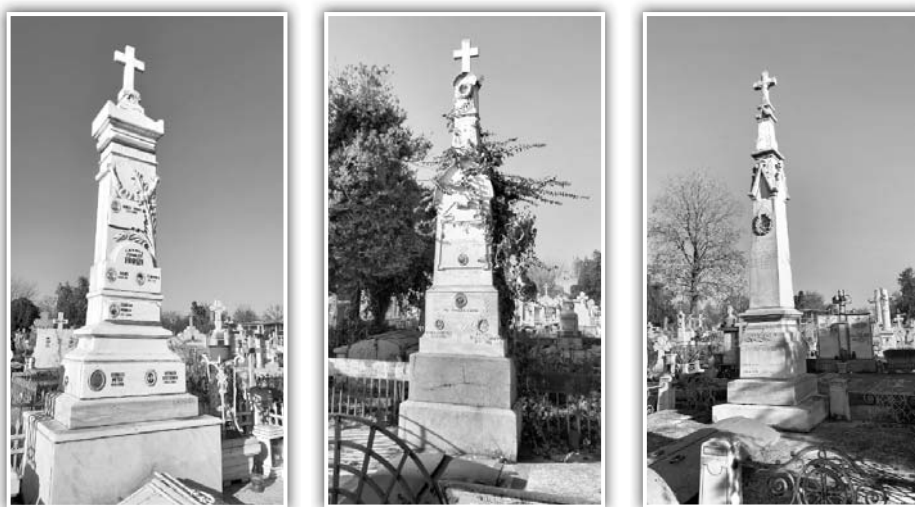
Fig. 5.a. Mormântul familiei Petrache Jeles; b. familiei Olaru; c. familiei Chivu

Deosebit este mormântul profesorului Nicolae Atanasiu († 1930, fig. 6), în formă de cruce, bogat ornamentată, ce aduce aminte de stilul brâncovenesc.