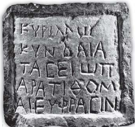
Lespedea de calcar cu inscripție de la Axiopolis, în care sunt menționate numele Sf. Mc. Cyrillus, Kyndaeas și Tasius (după V. Lungu, „The Christian Scythia”, p. 203)

Lespedea de calcar (0,33 x 0,36 x 0,09 m) pe care este gravată inscripția în care este menționat numele Sf. Mc. Cyrillus a fost descoperită printre rămășițele bazilicii extramuros de la Axiopolis, în vara anului 1947. Ea este binecunoscută în istoriografia românească și internațională. Pe fața principală, într-un chenar simplu în relief, este gravat textul Κυρίλλω / Κυνδαία / Τασείω π/αρατίθομ/αι Εύφρασιν ([Martirilor] Cyrillus, Kyndaeas și Tasius le încredințez pe Euphrasius) 1 . Cei trei martiri sunt