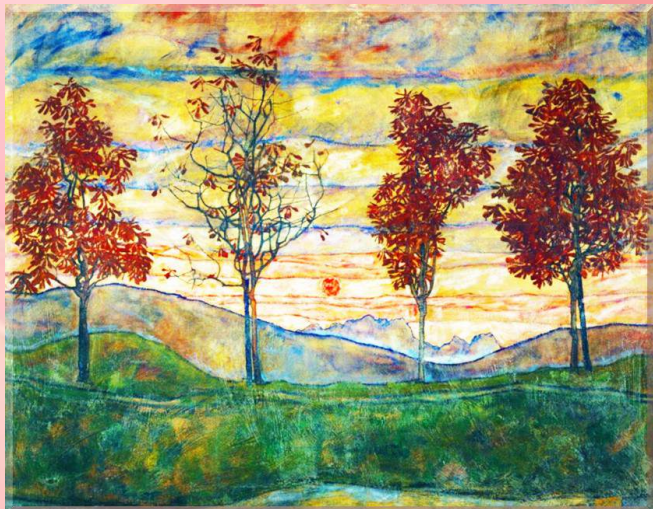
Patru copaci – Egon Schiele