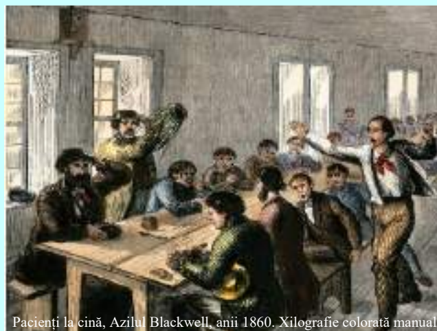
Pacienți la cină, Azilul Blackwell, anii 1860. Xilografie colorată manual

Pat 4: Spioni! Plățiți de unguri să mă urmărească, să-mi denigreze partidul! Scoateți-i afară! Să vină asistenta! Afară cu impostorii! Ajungem noi la putere! V-arăt eu, vouă, cu cine ați stat în salon. Jos trădătorii!