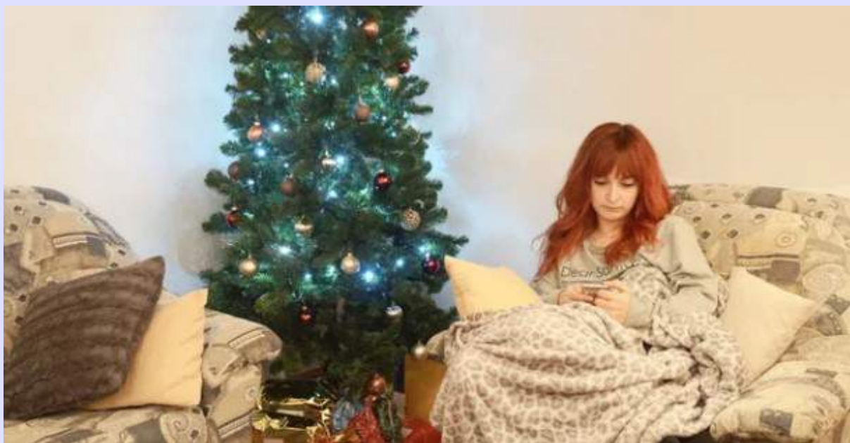
Singură în noaptea de Crăciun.