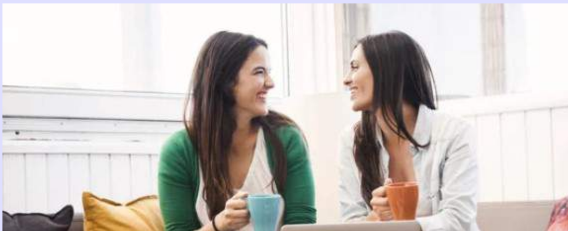
Cele mai bune prietene.