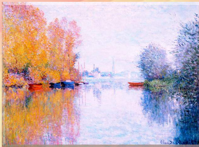
Toamna pe Sena la Argenteuil – Claude Monet