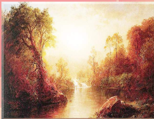
Toamna - Frederic Edwin Church