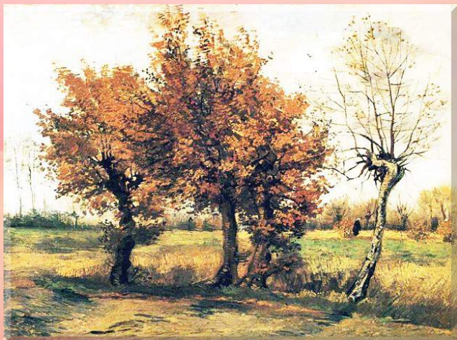
Peisaj de toamnă cu patru copaci – Van Gogh