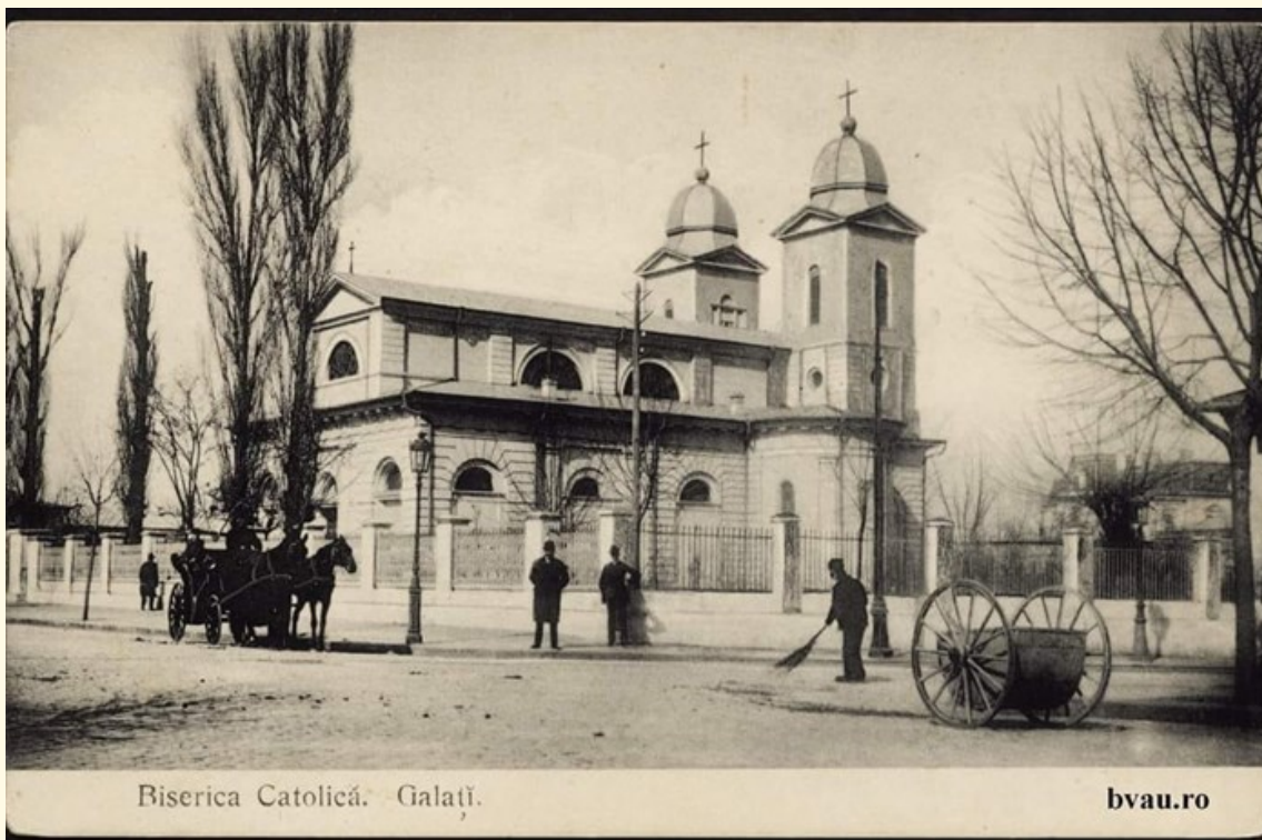
Biserica Catolică. Galați.