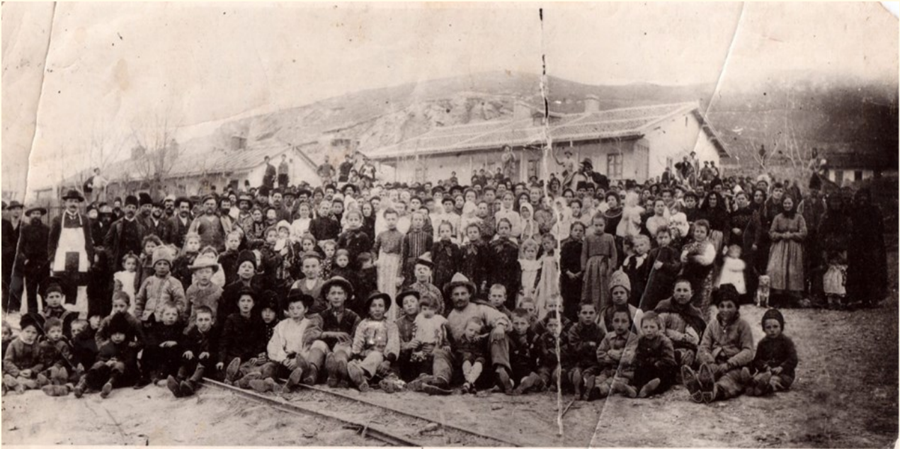
Cca. 1910. Colonia de friulani și italieni de la Greci, la cariera de la Iacobdeal