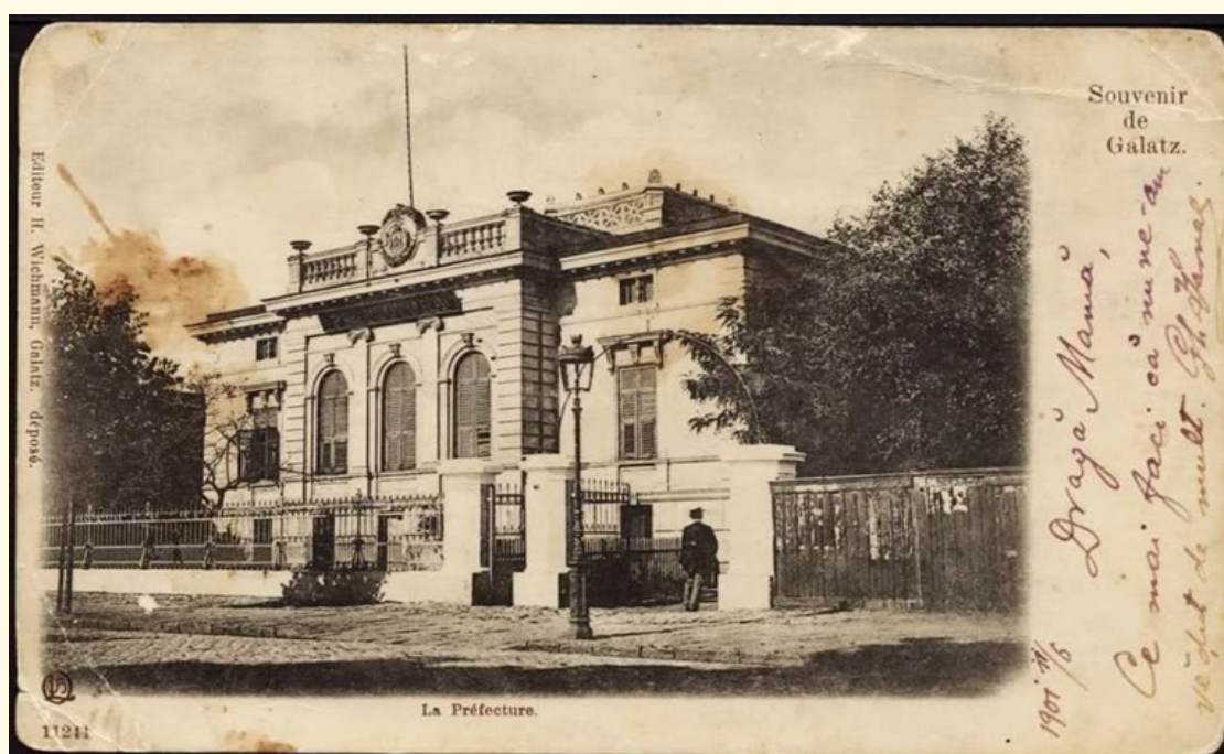
1901 - Prefectura Galați.