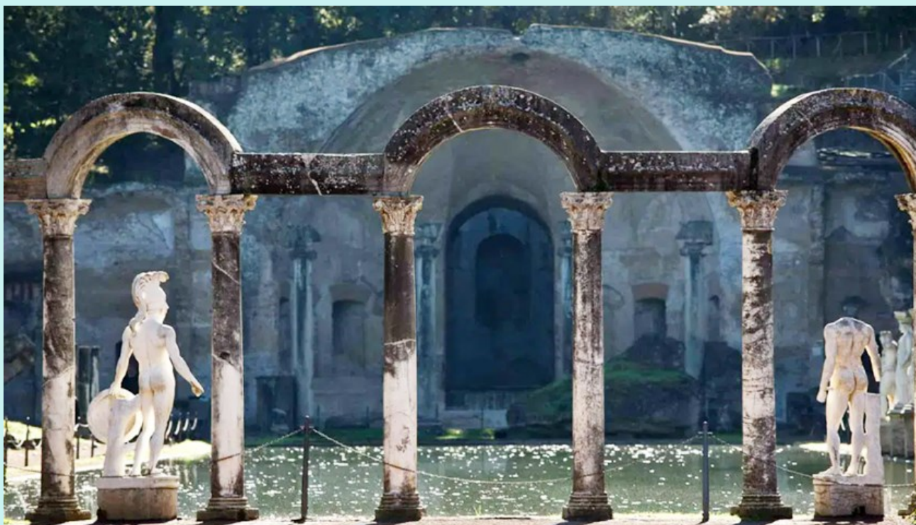
Vila fastuoasă a lui Hadrian din Roma antică