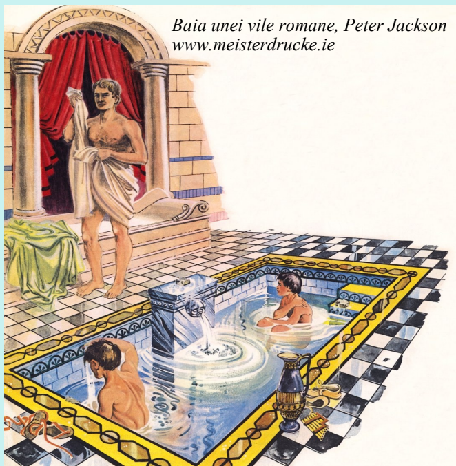
Baia unei vile romane, Peter Jackson www.meisterdrucke.ie