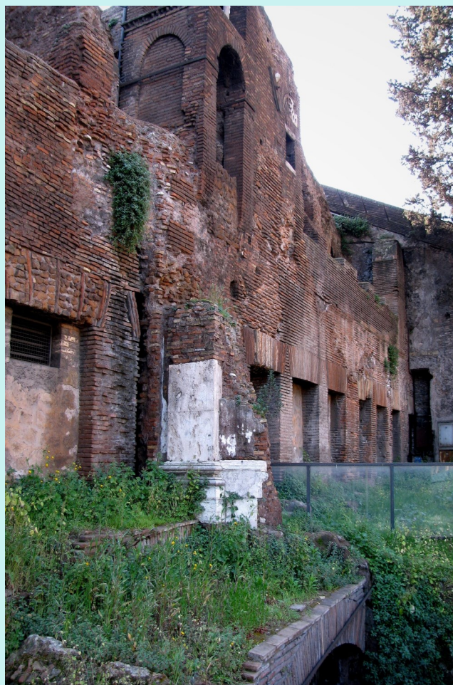
Insula Romană lângă Santa Maria în Aracoeli, pe Dealul Capitolin. Domeniul public