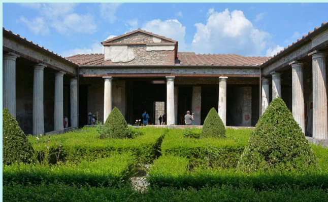
Casa lui Menander (a Domus) din Pompeii, imagine oferită de Hub Pages