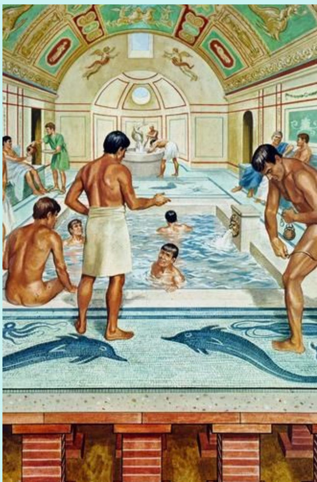
Băile Romane și Sistemele de Canalizare