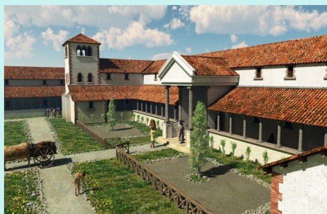
Vila romana rustica

Pardoseala din triclinium era foarte importantă. Sub ea se săpa la o adâncime de două picioare, solul se bătea bine cu maiul, peste care se turna un beton din pietriș/ țigle sparte și se nivela, dându-i-se o pantă de scurgere către un canal de colectare. Apoi se întindea un strat de cărbuni, bine bătătorit, peste care se turna o pătură de mortar grosă de jumătate de picior (un picior roman = 29,57 cm) dintr-un amestec de pietriș, var și funingine.