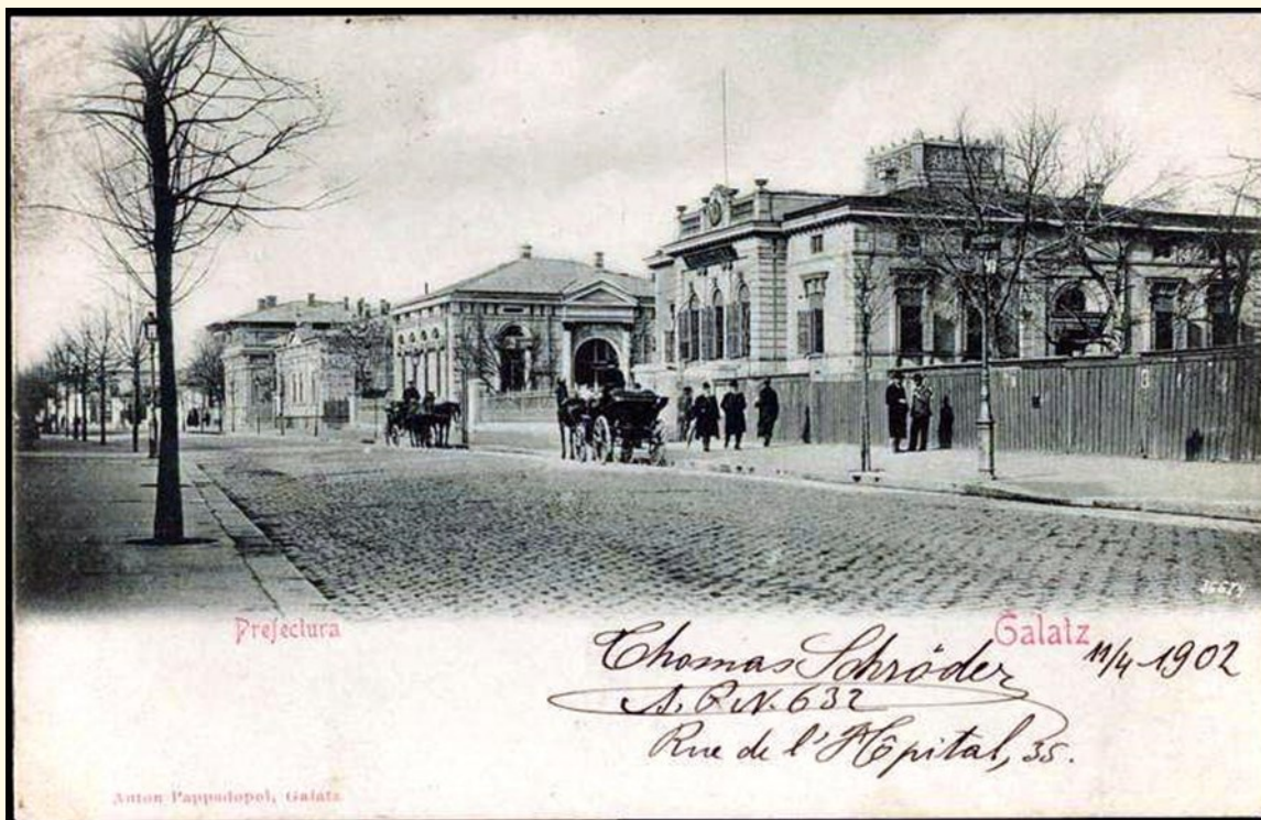
Carte poștală circulantă în 1902, cu strada Domnească din Galați și clădirea Prefecturii în prim plan

Clădirea a avut în continuare aceeași soartă, fiind permanent închiriată diferitelor instituții, până când a ajuns o ruină. În anul 2022, ca urmare a unui proiect european derulat de Primăria Municipiului Galați, a fost refăcută și acum găzduiește diferite manifestări culturale sub noua denumire de Casa Artelor.