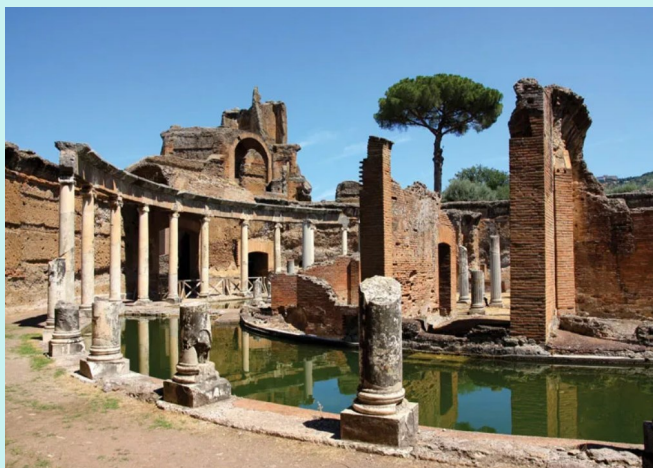
Vila lui Hadrian, Tivoli, Italia

Vila urbană – într-un loc cu panoramă: munte, mare. Era reședința de vară. Locul se transforma într-o adevărată grădină.