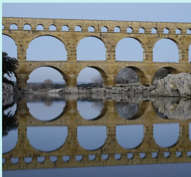
Apeduct în Roma antică

Nicio pagubă!... Vor să trăiască la Roma? La Roma se mai și moare!...”