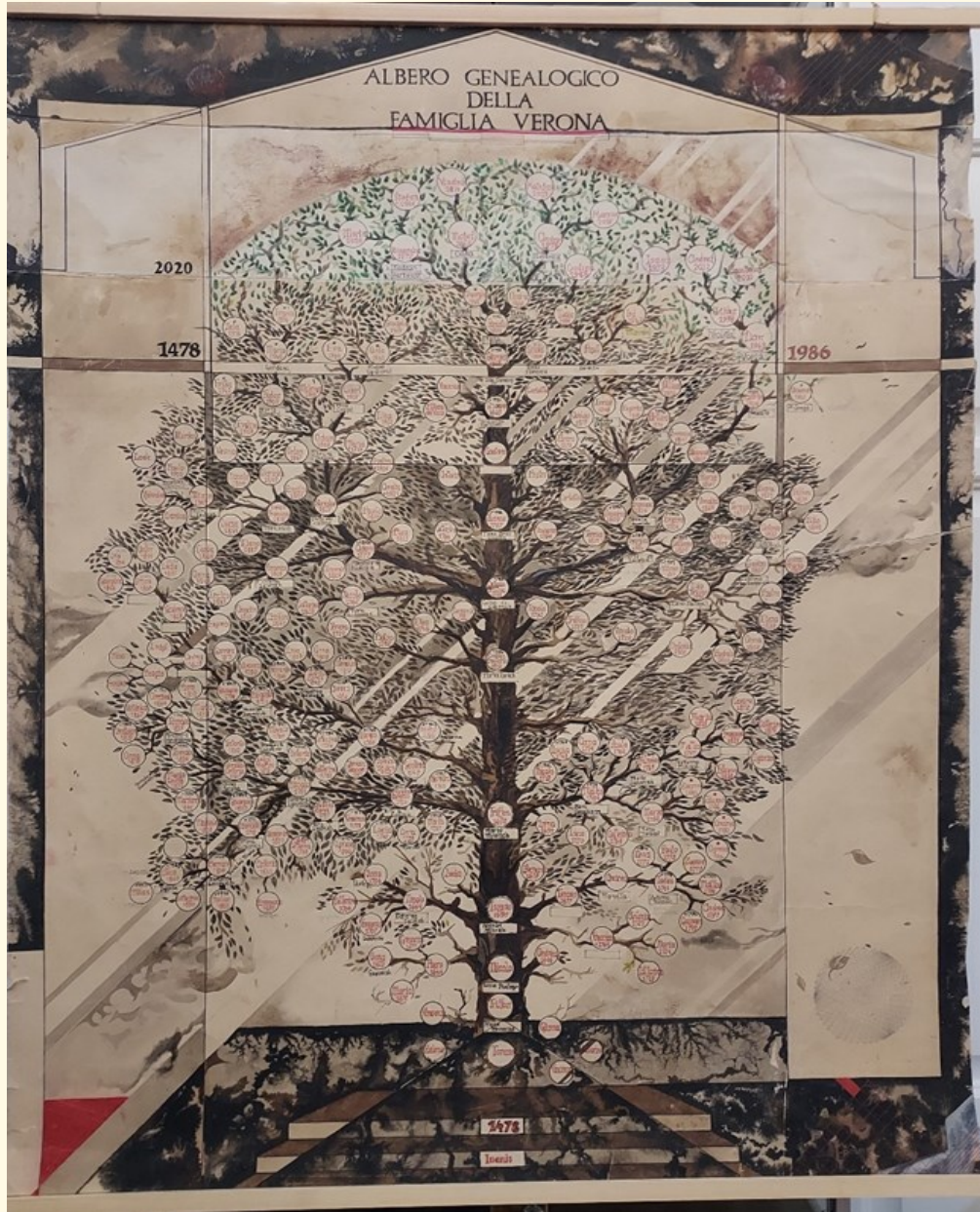
Arborele genealogic al familiei Verona.