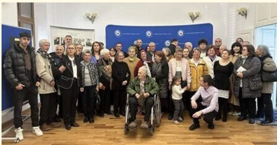
Participanții la întâlnirea comunității „Casa d'Italia” a Asociației Italienilor din Galați