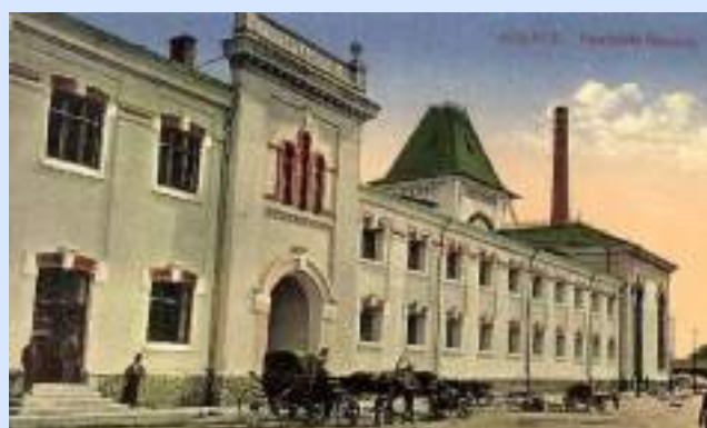
Pescăriile statului la 1913