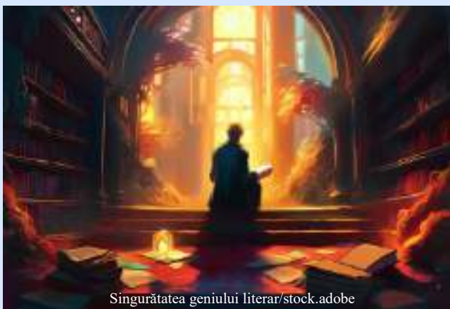
Singurătatea geniului literar

Am avut, de-a lungul vieții, nenumărate experiențe legate de ingratitudea oamenilor. Nici măcar cei care ar trebui să-mi fie recunoscători nu dau doi bani, dacă există sau nu. Asta mă face să mă socotesc ca o curea de transmisie sau trambulina de pe care îți iei avânt, ca să sari calul sau capra. O bătaie puternică din picioare și saltul spectaculos în aer pentru a trece dincolo de aparat.