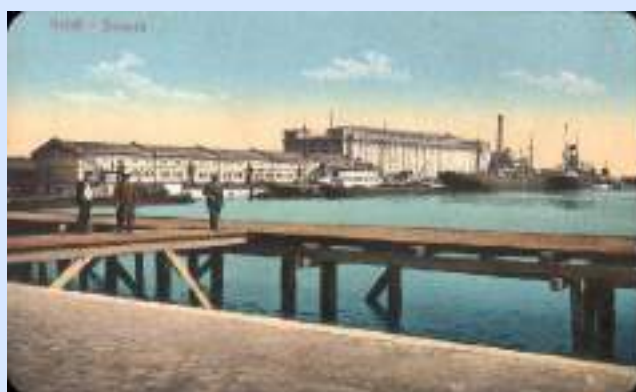
Portul Galați (Docurile)